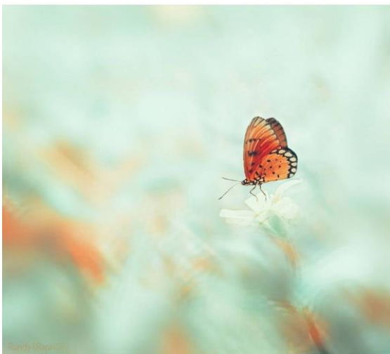
Gambar 1: Efek Tools Whirl dan Dizziness